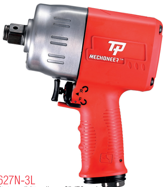
TPT-2627N-3L 3/4" Avvitatore diretto albero 3" (76mm)